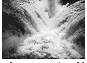
Вместе или каждый за себя? Кто же двигало людьми на протяжении истории человечества? Наверное — стремление к Благому, прежде всего, к удовлетворению своих материальных потребностей — в пище, жилье, одежде, к повышению уровня своей жизни. Как этого достичь? История знает лишь два пути.

В рабовладельческом, феодальном, капиталистическом обществах, где царил принцип «каждый за себя, один Бог за всех». Каждый сражался за выживание в одиночку — «или пан, или пропасть». Частная собственность на всех этапах истории породила страшное зло. Эксплуатация человека человеком, захватнические войны, моря крови, горы человеческих черепов, бесмерная алчность и злоба — и это ради обогащения за счет ограбления и порабощения тружеников, руками которых созданы все богатства.